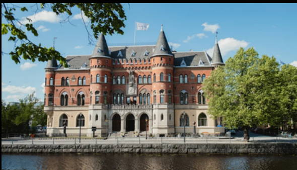
Home Hotel Borgen vackert beläget vid Svartån i Örebro

Örebro Stadsmission behöver kraften i lokala företag, organisationer och föreningar för att bättre kunna hjälpa utsatta människor. Vi ska aldrig ersätta de offentliga insatserna men komplettera och stärka upp där systemen brister. Samhället blir en tryggare och bättre plats för alla när människor i utsatthet släpps in i gemenskapen. Våra partners är en avgörande aktör i vårt arbete med att skapa förändring och hjälpa de mest utsatta människorna. De företag som ingår partnerskap med oss, får också en djupare insyn i vårt arbete och situationen i vårt län.